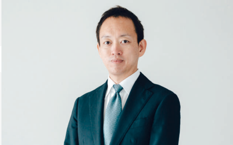
税理士法人ブラザシップ 包括代表社員 株式会社ブラザシップコンサルティング 代表取締役 公認会計士・税理士