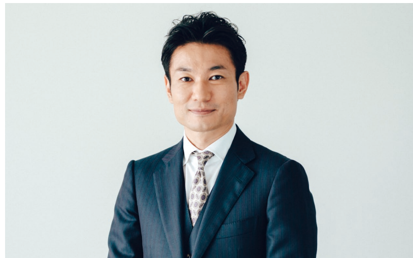
税理士法人ブラザシップ 代表社員 公認会計士・税理士

大手監査法人にて勤務後、税理士事務所を開業。自身の経験による中小企業経営者へのリスペクトと「日本の中小企業を活性化させたい」という熱い思いを抱える。経営支援業務を中心に、約600社の中小企業の経営・財務改善に携わってきた。クライアントに寄り添い、ともに課題や打開策を見出す経営支援に定評がある。