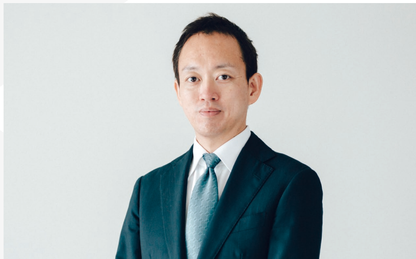
税理士法人ブラザシップ 包括代表社員 株式会社ブラザシップコンサルティング 代表取締役 公認会計士・税理士